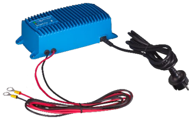
Blue Smart IP67 acculader 12/25