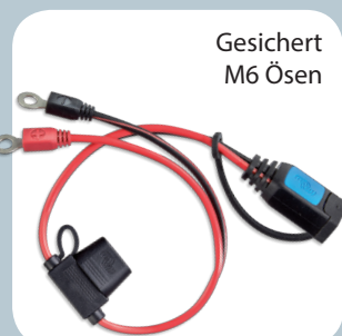
Gesichert M6 Ösen